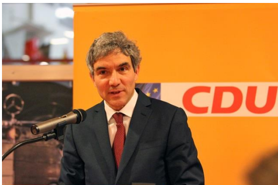
Dr. Stephan Harbarth

Sinsheim. Über 5.000 Fallschirmsprünge hat Eberhard Gienger bereits absolviert, am vergangenen Mittwochabend schaffte der CDU-Politiker, der seit 2002 als Abgeordneter den Wahlkreis Neckar-Zaber im Deutschen Bundestag vertritt, wiederum eine Punktlandung – in den Herzen der rund 180 Gästen des Neujahrsempfangs der CDU Rhein-Neckar